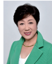
Ms. Yuriko Koike