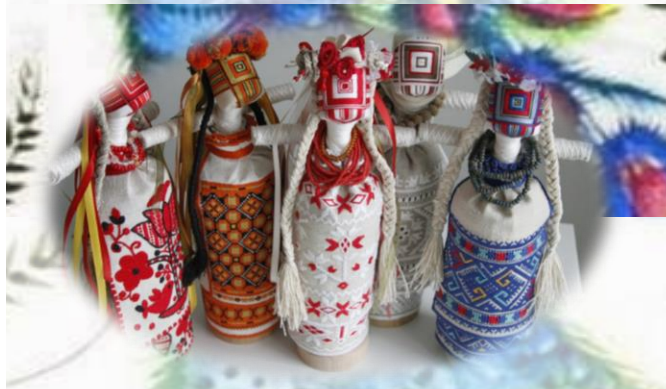
展示写真の一例

1000年以上の歴史を誇る古都キーウ (キエフ)や、世界遺産の聖ソフィア 大聖堂をはじめとする数多くの観光ス ポットは、毎年国内外からの多くの訪 問者で賑わっています。日本ではまだ 知られていないウクライナの魅力を、 写真や民芸品を眺めながら発見しませ んか？