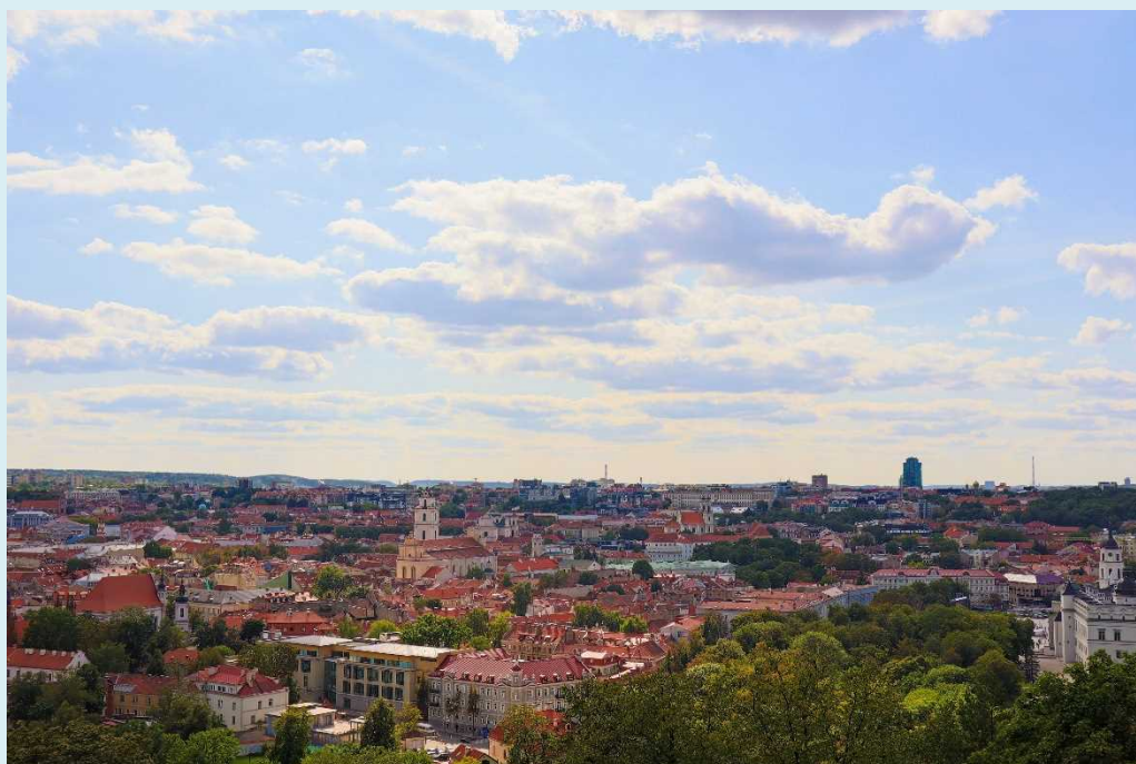
〈ヴィリニウス大学と旧市街〉