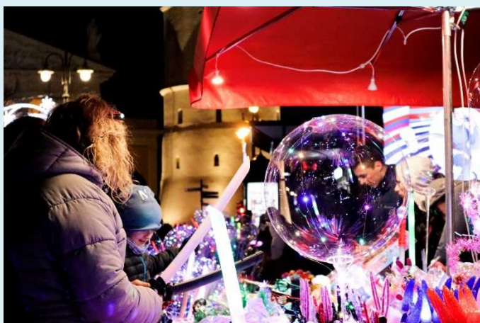
〈ヴィリニウス大聖堂とクリスマスマーケット〉