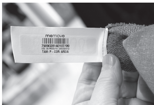
図2 ブラジルのアパレルにおける RFID 活用事例