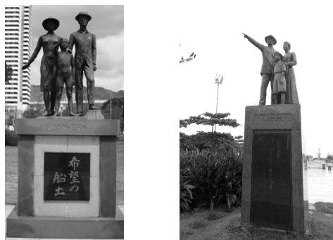
図2 神戸港(左)とサントス港(右)の移民像